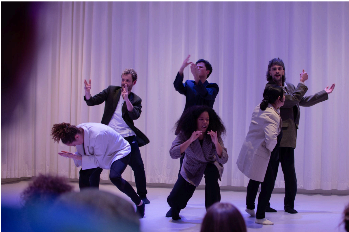
Eindpresentatie workshopreeks/artistiek vooronderzoek Heartbeat bij Nowhere in Amsterdam-Oost