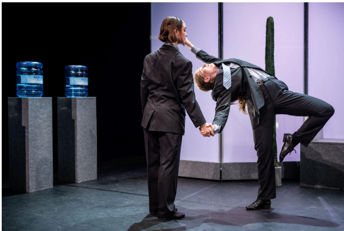
Scenefoto Heartcore Kantoor

Heartcore Kantoor is een artistiek succes met waarderende recensies. Hiermee zetten we MAN || CO, na het winnen van de Jonge Zwaan meest indrukwekkende jeugddansproductie 2024 voor Op een onbewoond , op de kaart als collectief dat óók stevig werk maakt voor volwassenen.