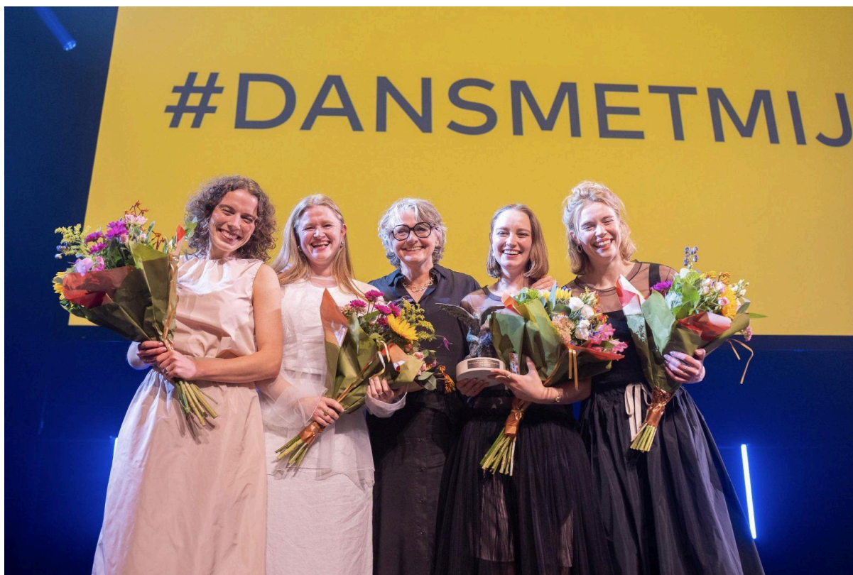
MAN || CO wint de Jonge Zwaan meest indrukwekkende jeugdانسproductie 2024 met Op een onbewoond