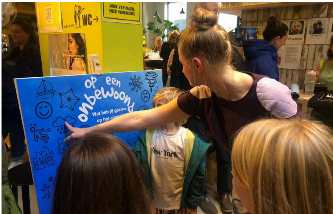
Foto: Roma met het jonge publiek tijdens de interactieve foyer van Op een onbewoond

Ook ontwikkelden we voor het eerst een interactieve foyer, een klein en prikkelend publieksprogramma in de foyer van het theater. Met de interactieve foyer willen we de voorstelling (nog) meer laten beklijven en verbinding tussen publiek over voorstelling en thematiek stimuleren.