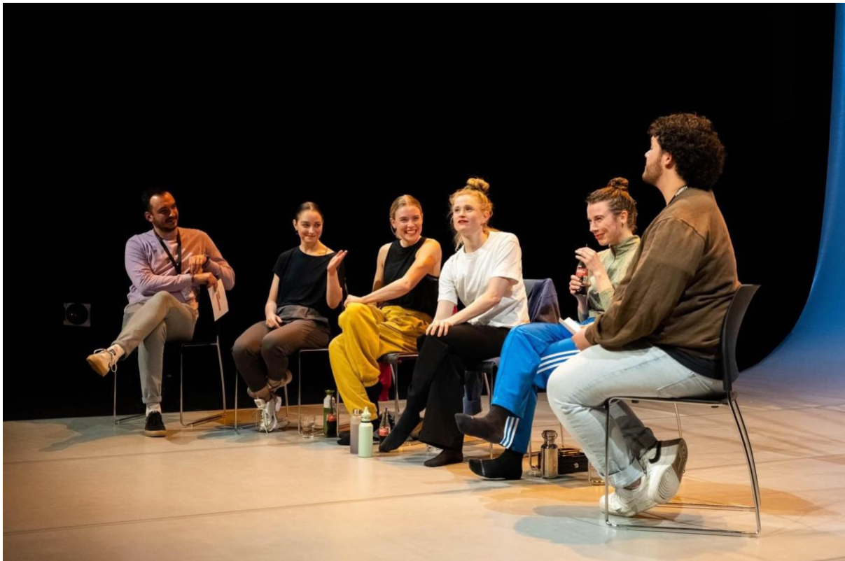
What a time to be alive – Podium HU x Theater Kikker

Jaarverslag 2022 Stichting MANCO bewegingstheater Goedgekeurd tijdens bestuursvergadering 29 juni 2023