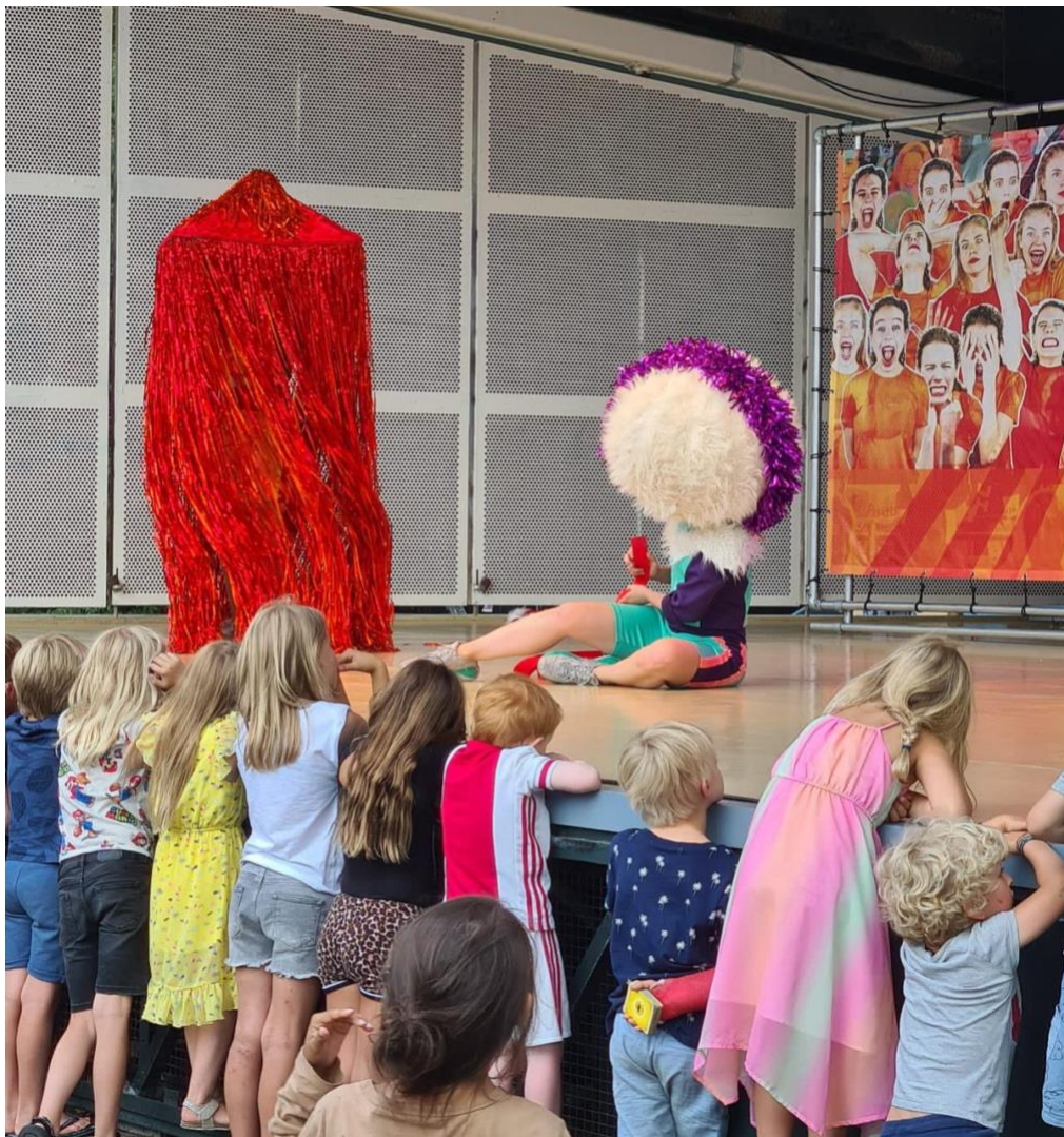
foto: Boom goes the dynamite in Vondelpark Openluchttheater, augustus 2022