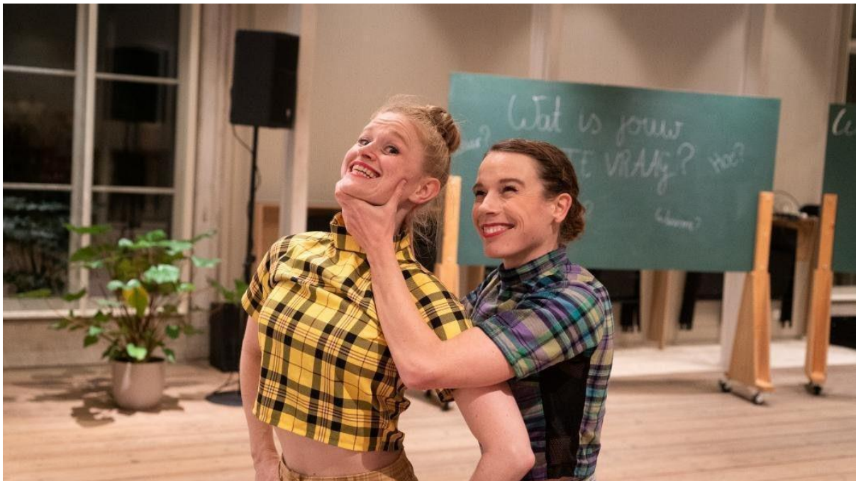
Pop-up voorstelling tijdens Museumnacht

Zeer uiteenlopende, onconventionele plekken waar we met de (spontane) kijker in gesprek zijn gegaan. Daarnaast was MAN || CO te gast bij een round-the-table-gesprek op het Give-A-Dance!-Festival en ging daar met de collectieven Chronos en Moha in gesprek over alternatieve samenwerkingsvormen, collectief werken en interdisciplinaire focus. Dat was een inspirerende aangelegenheid, die ons trots maakte en ons weer liet inzien waarom we doen wat te doen.