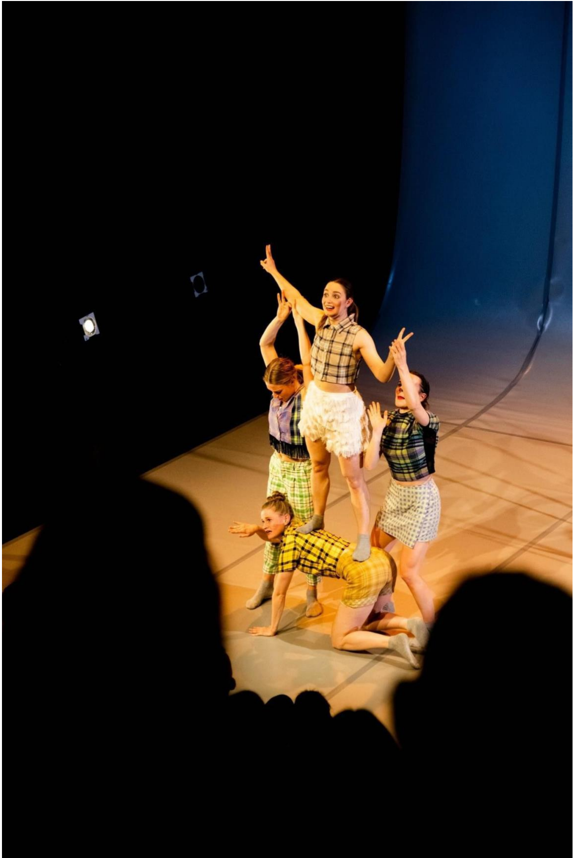
What a time to be alive – Podium HU x Theater Kikker